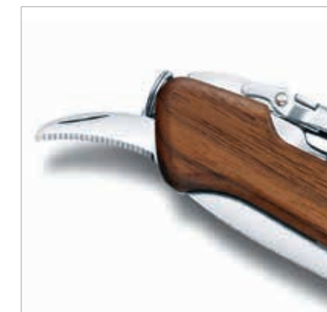
Der «Wine Master» vereint alle Werkzeuge, die ein perfekter Begleiter auf Reisen und für Picknicks benötigt - Brotzeitmesser, Korkenzieher und Kapselschneider in einem.

▼ Gutschein abtrennen und an der Kasse vorweisen ▼