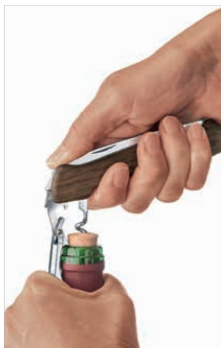
Durch das 13 cm lange Gehäuse wird eine optimale Hebelwirkung erzielt.

Heute gibt es Korkenzieher in den unterschiedlichsten Formen. Für Weinliebhaber sind sie ein unverzichtbares Instrument. Dabei gehen die Meinungen und Präferenzen zum Modell und zur Funktion weit auseinander: lieber stilisch oder zweckmässig und einfach zu handhaben? Manche präferieren einen klassischen T-Korkenzieher, die einen öffnen ihren Wein mit einem Flügel- oder einem Hebelkorkenzieher, und andere greifen wiederum auf ein sogenanntes